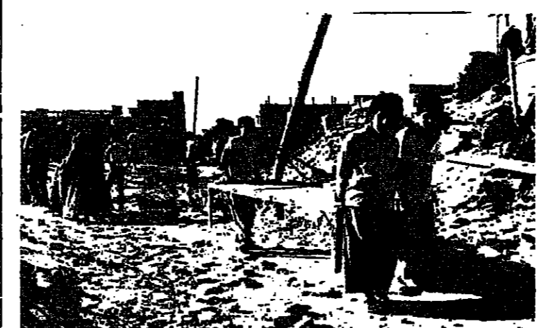
مظهر للدمار في مدينة ديزفول بعد ان قصفها العراقيون بصواريخ أرض-أرض سوفياتية الصنع من طراز « فروغ » .

طهران - اصدرت وزارة الخارجية الإيرانية بيانا امس شجعت فيه مهاجمة مدينة ديزفول العراقية بصواريخ أرض-أرض عراقية من صنع سوفياتي ، ووصفت هذا القصف بأنه اعتداء غير انساني على بلدة مسالمة تخضع للائحة الدولية والانسانية ودعت وزارة الخارجية الإيرانية المنظمات الدولية للعمل على منع العراق من استخدام مثل هذه الصواريخ في المستقبل ، وقد اسفر هذا القصف عن مقتل ١٠٦ أشخاص وجرح ٢٩٠ شخصا .